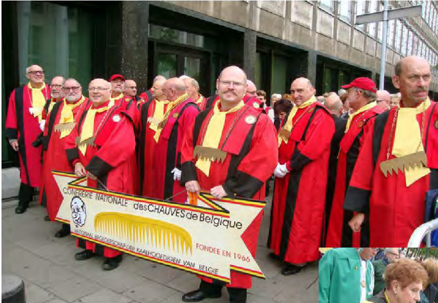
Ci-contre, à gauche, nos Chauves belges. En-dessous d'eux, la Police veille au grain.