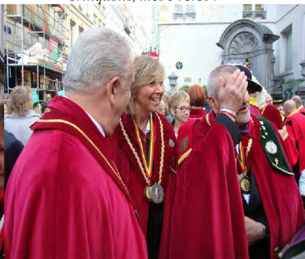
Serait-ce déjà le coup de bambou ?

Ces joyeuses libations entrecoupées de discours officiels ont emballé la bonne humeur des uns et des autres, y compris les nombreux touristes aux regards amusés. Elle se vérifiera encore dans l'immense salle des fêtes de Berchem-Ste-Agathe que nous rejoignons en car.