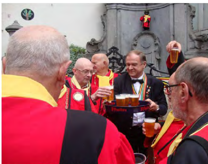
La distribution du nectar.