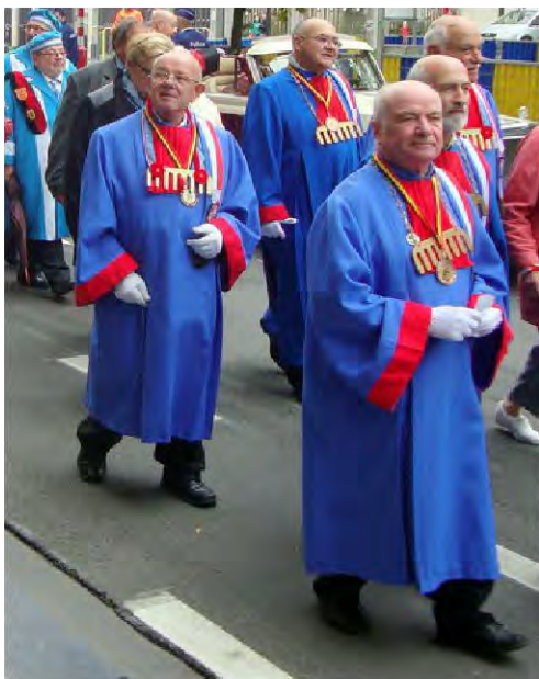
A gauche, la Confrérie des Chauves de France.