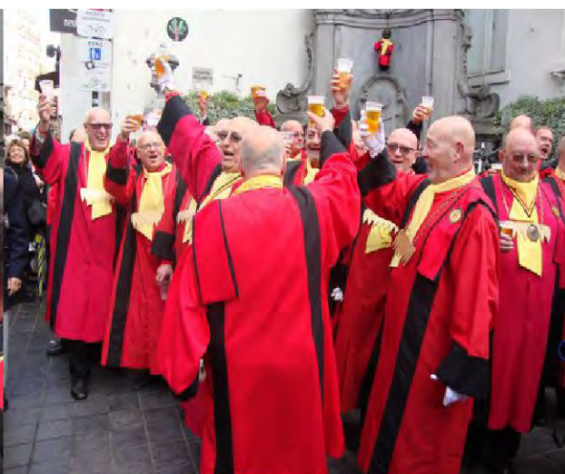
Trinquons, mes Frères !