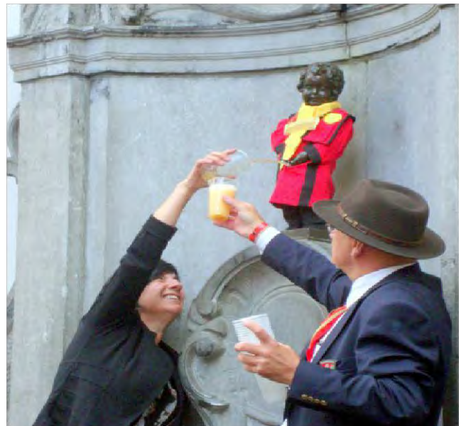
1. Un jet vigoureux mais à blanc. 2. La récolte de la Chambourlette bénie.